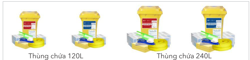
Thùng chứa 120L