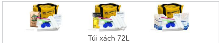
Túi xách 72L