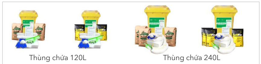
Thùng chứa 120L